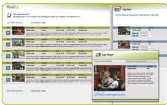
Trouvez vos séquences et créez une liste de montage (EDL)

Accédez instantanément à vos séquences vidéo pendant que vous tournez. Grâce à Reality , vous êtes maintenant en mesure d'encoder et de décrire le contenu vidéo en temps réel. Vous pouvez ainsi repérer et visionner des scènes précises en cours de tournage, et commencer à créer votre émission sur-le-champ.